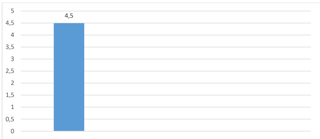
Gráfico 3 – Avaliação dos Técnicos Administrativos

No gráfico 3, apresenta-se o resultado da pesquisa com os respondentes do corpo técnico-administrativo.