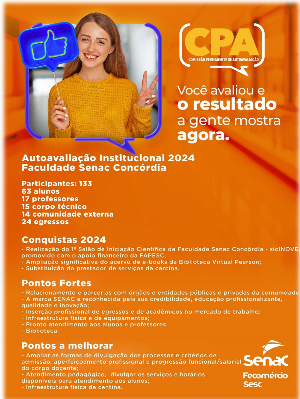
Figura 1 – Forma de divulgação dos resultados obtidos na pesquisa da CPA