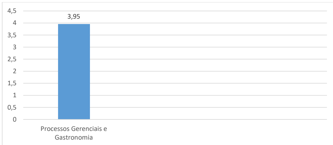
Gráfico 4 – Avaliação dos egressos